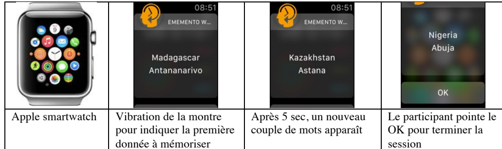
Figure 2 : Smartwatch application screenshots

L'ergonomie de l'application a été conçue de manière épurée :